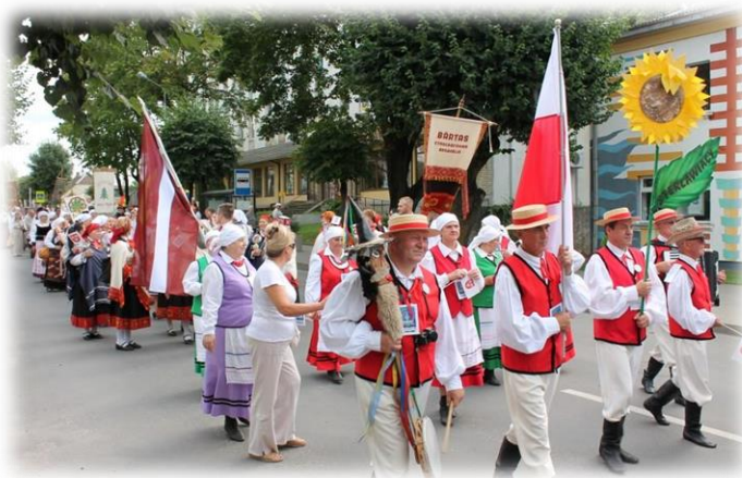
Nuolatiniai Jurbarko svečiai – ansamblis „Sterławiacy“